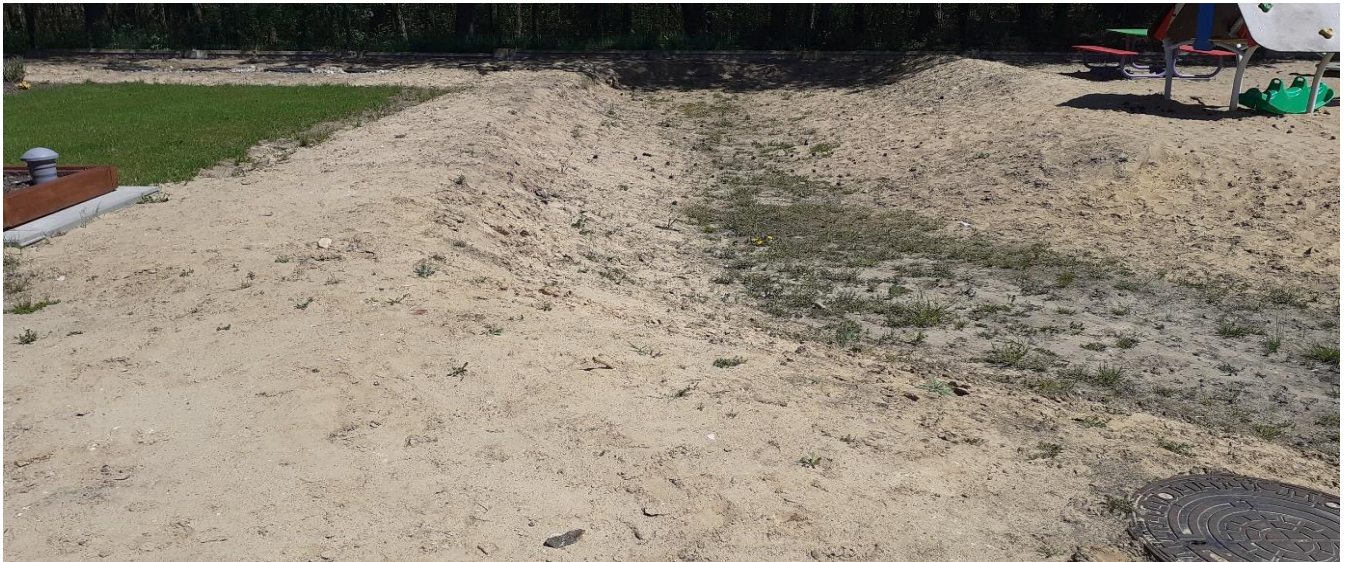
Strefa roślin zadarniających, wrzosowatych i cieniulubnych. Po lewej - gazon/ podwyższona grządka krzewów i bylin owocowych.