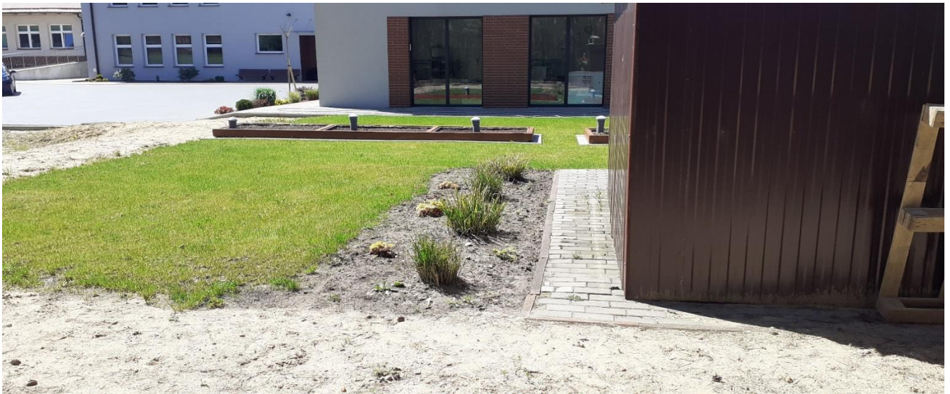
Widok okien przedszkolnych i szkoły z placem – na pierwszym planie rabata z drzewami owocowymi. Po prawej rabata krzewów owocowych, a za nimi na ścianie budynku strefa budek lęgowych.