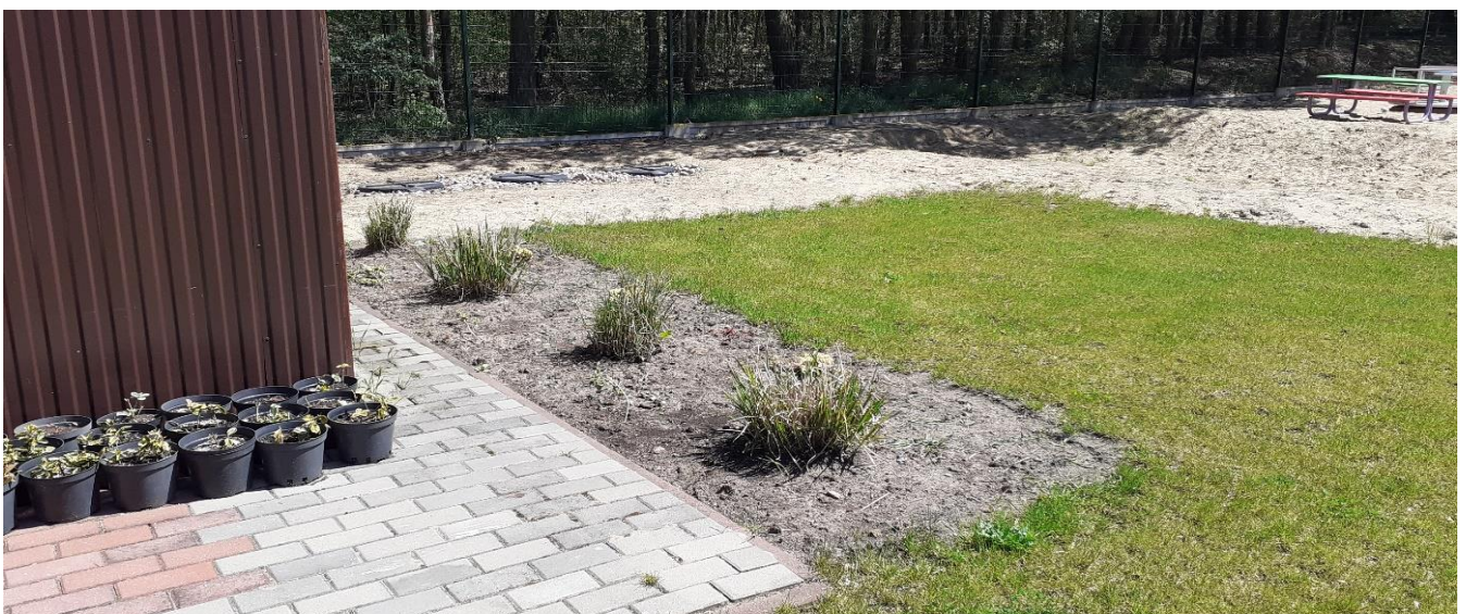
Miejsce usytuowania zbiornika na deszczówkę i wzorcowego karmnika. Na ścianie budynku gospodarczego strefa dla owadów.