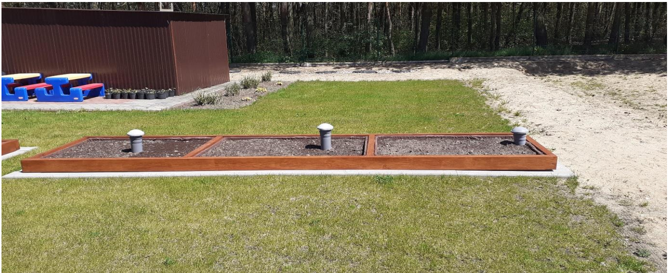
Widok na miejsce usytuowania kuchni ogrodowej. Po lewej stronie ściany budynku gospodarczego tablica informacyjna.