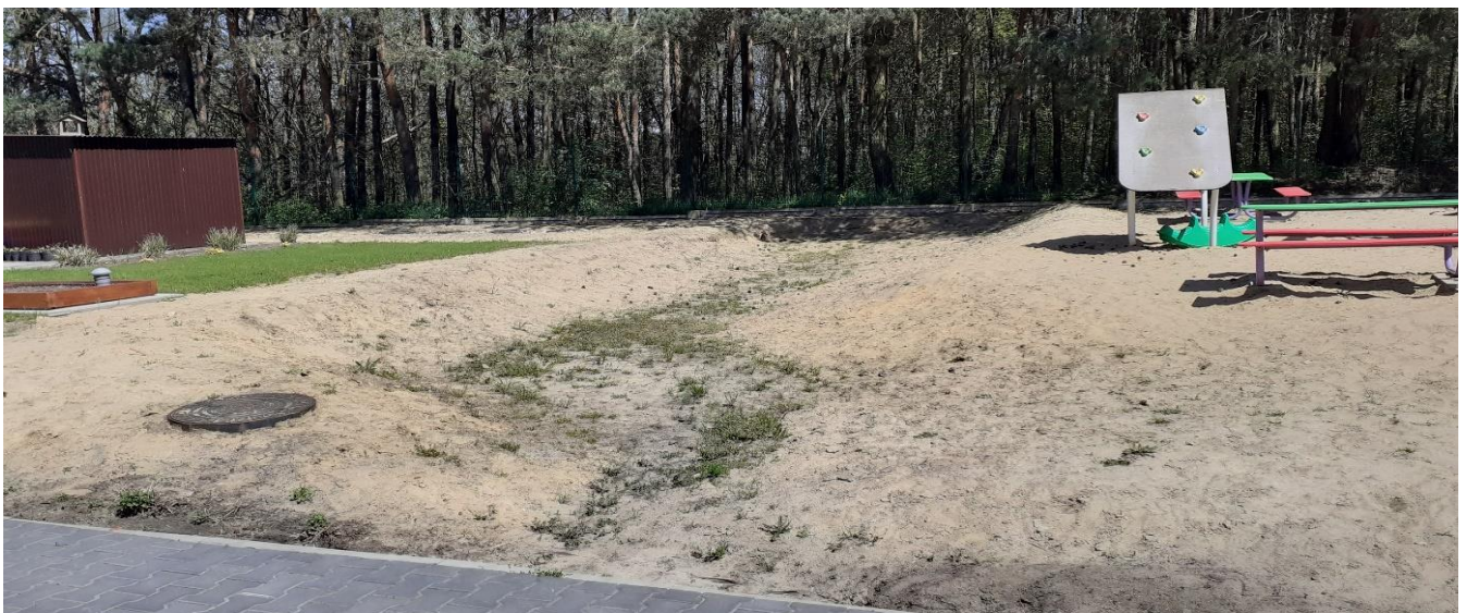
Widok skarpy do ustabilizowania geokratą i kantówką.