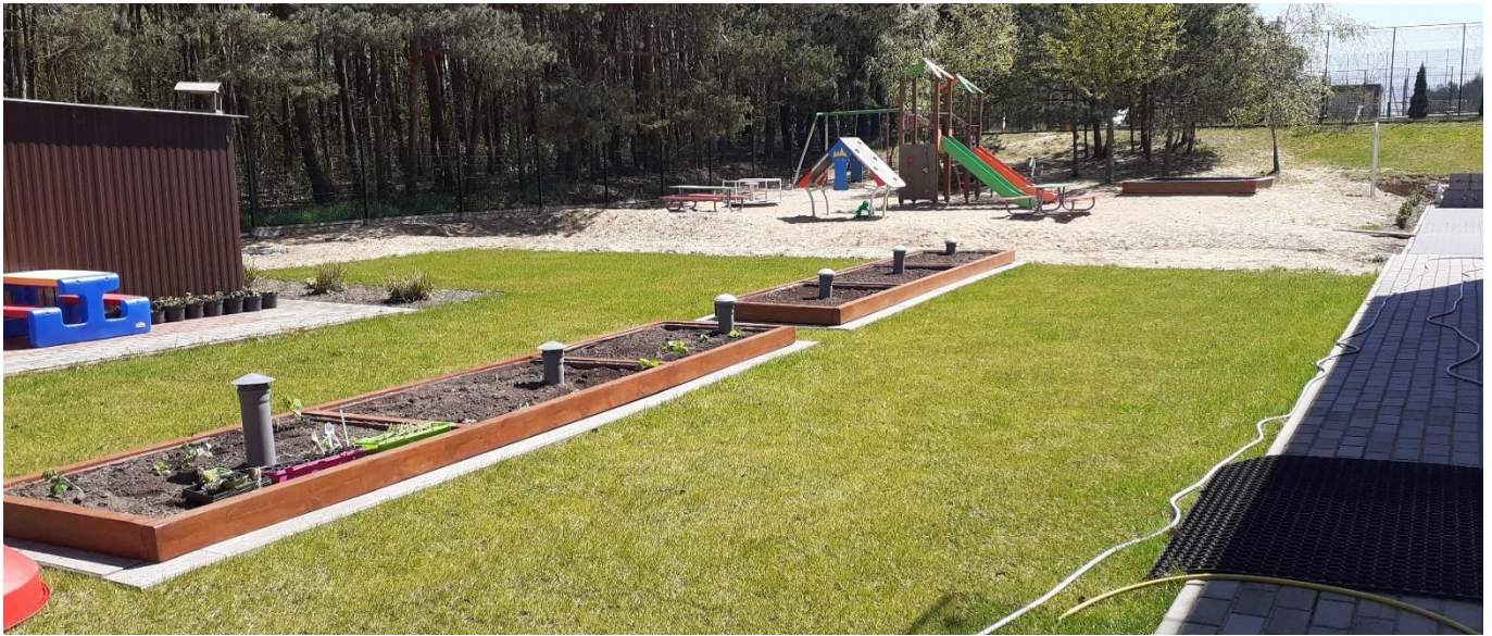
Rabata i ścieżka sensoryczna tworzona z materiałów naturalnych.