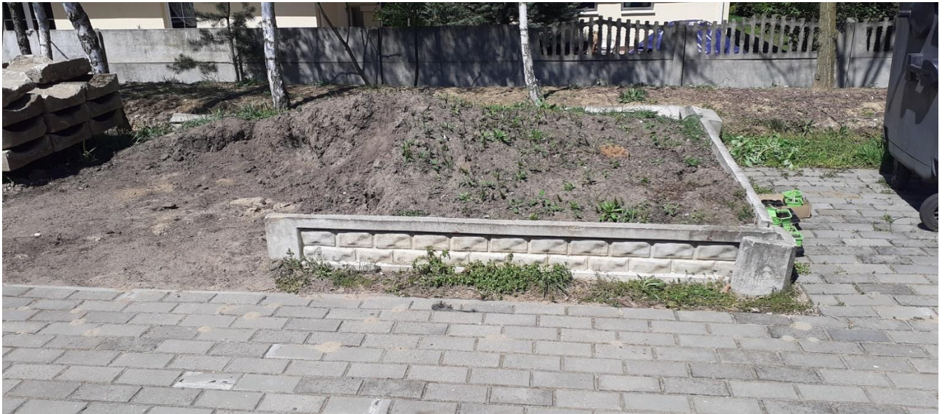
Teren na którym stanie strefa kompostu i podwyższona rabata z kwietną łąką. Z tyłu kompostowniki. Po lewej dereń a za nim domek ogrodnika – szopy na narzędzia ogrodnicze.