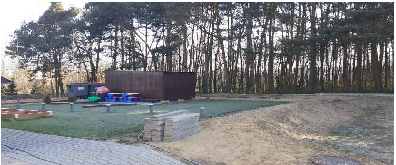
Widok na ogród dydaktyczny od strony placu przed szkołą.